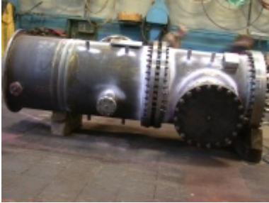
Fa. Hydac Fertigung nach ASME Werkstoff= SA516 GR70