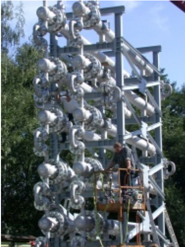
Fa. Josef Meissner Fertigung nach ASME Werkstoff= SA-240/316TI H= 8.230 / B= 2.000 / L= 7.285 / kg= 39.200